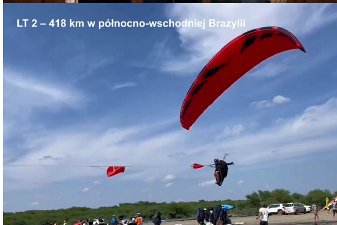
LT 2 – 418 km w północno-wschodniej Brazylii